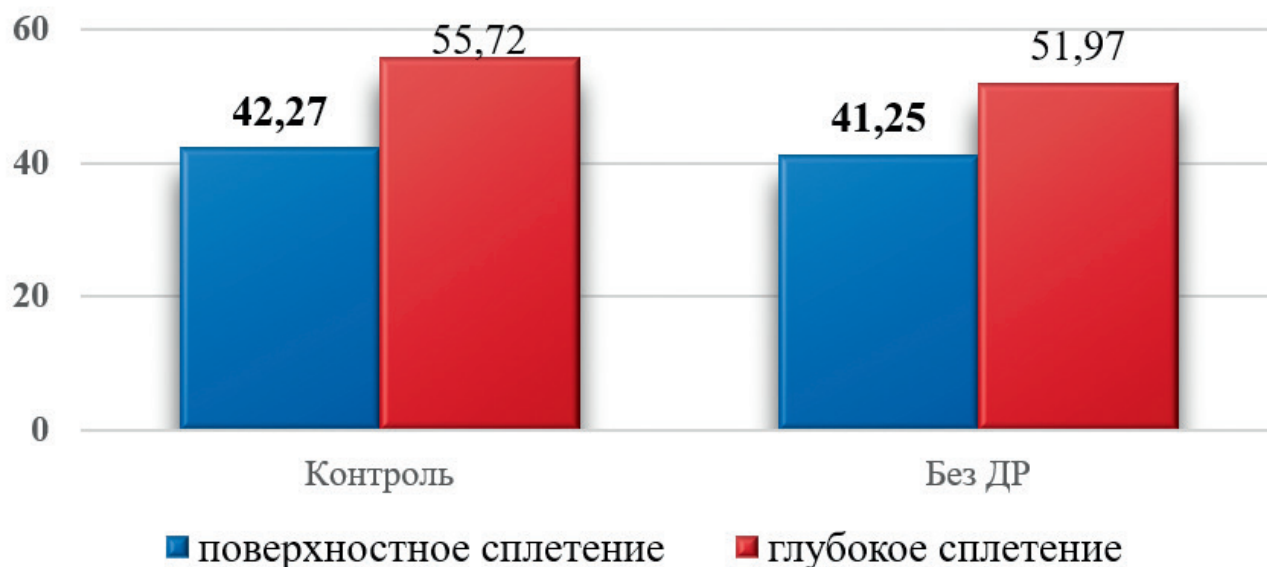
Рис. 2. Плотность парафовеальных сосудов поверхностного и глубокого сплетения.

При исследовании плотности парафовеальных сосудов глубокого сплетения (Parafovea DCP) выявлено значительное снижение параметров кровотока 51,97 \pm 7,15^* у пациентов без ДР ( P = 0,012 ) по сравнению с нормальным контролем 55,72 \pm 9,36 ( P < 0,001 ). Это подтверждает мнение об относительно первичном вовлечении глубокого сосудистого сплетения при других сосудистых заболеваниях сетчатки [9]. В нашем исследовании снижение плотности парафовеальных сосудов глубоких капиллярных сплетений наблюдалось у пациентов без офтальмологических признаков ДР по сравнению с контролем ( P < 0,001 ), что может служить наиболее ранним маркером диабетической ретинопатии.