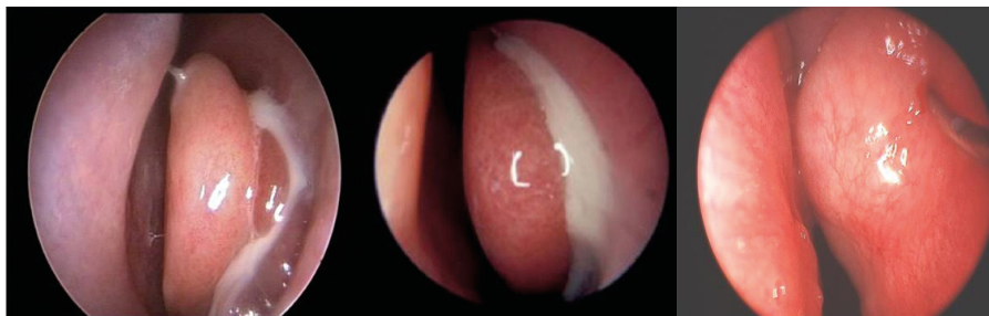
1-расм. Ўткир риносинусит билан касалланган беморларнинг эндоскопик текширув натижалари

Бурун бўшлиғи анатомик тузилишининг ўРС ривожланишига ва сурункали шаклга ўтишига мойил бўлган турли хил вариантлари орасида бурун тўсиғининг қийшиқлиги устунлик қилди, яъни беморларнинг 27,5%ида аниқланди.